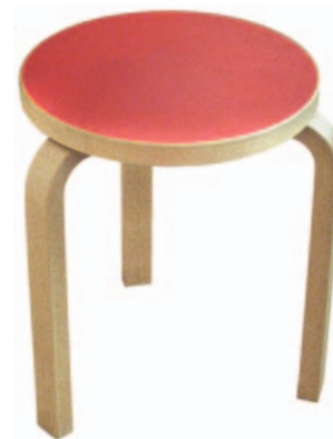
ALVAR AALTO TABURET